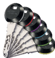
Os clips transponder RFID apresentam uma gama de 6 anéis coloridos, para uma fácil identificação