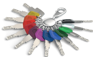
Para a LK ( chave grande ), existem clips em 12 cores.